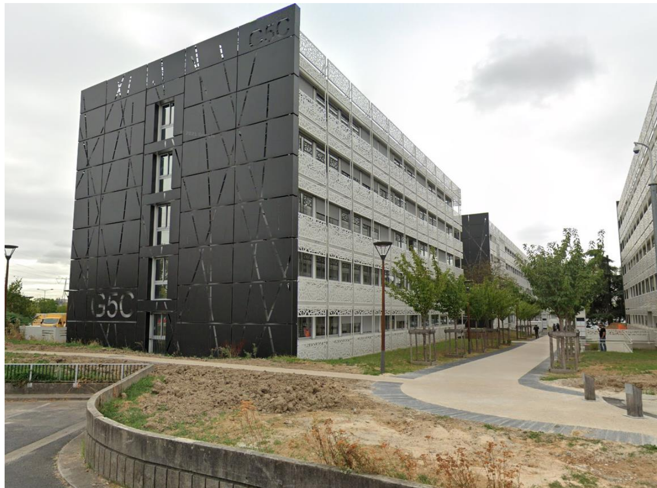
Bâtiment G5C situé dans la zone administrative du Marché International de Rungis

Certaines activités entraînant des charges au sol trop lourdes ne pourront être développées.